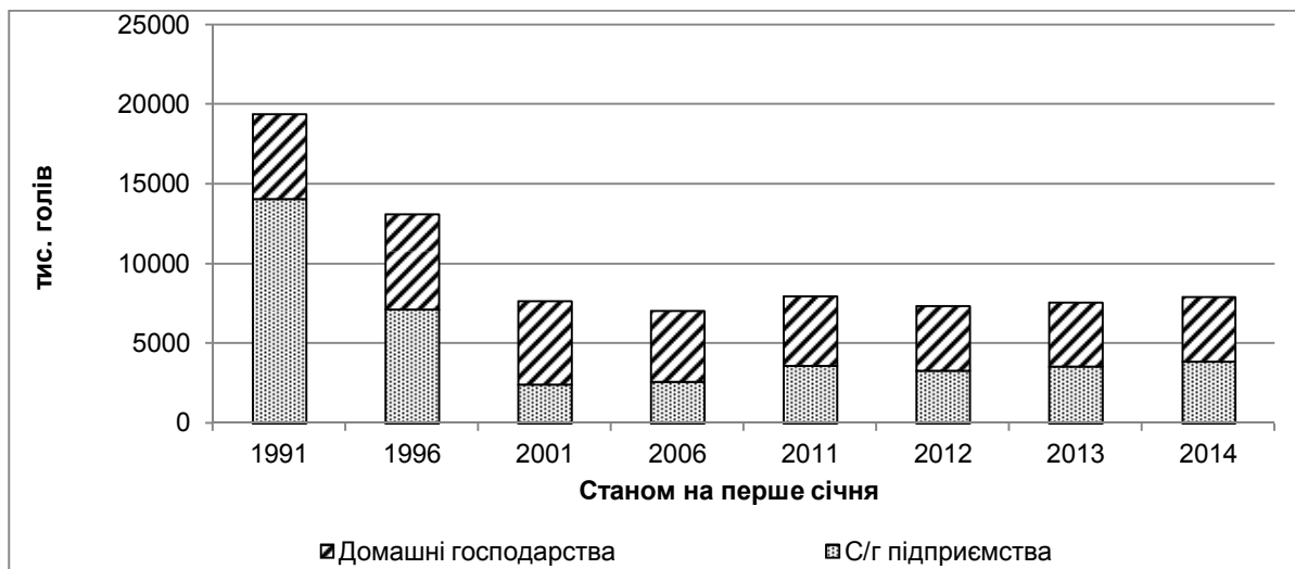
Рис. 1. Зміна поголів'я свиней в господарствах усіх категорій підприємств за 1991-2014 рр.

частини свиновідгодівельних комплексів. Кількість свиней на підприємствах на 1 січня 1991 року становила 14017,2 тис. голів, а станом на 1 січня 2014 року – 3878,9 тис. голів, що складає всього 27,67% від показника 1991 року. Ситуація в домашніх господарствах населення суттєво не змінилася, скорочення відбулося на 24,50% з 5355,7 тис. голів до 4043,3 тис. голів і його можна пояснити демографічними факторами, такими як скорочення сільського населення та населення країни в цілому. На рис. 1 можемо прослідкувати тенденції зміни поголів'я свиней за роки незалежності.