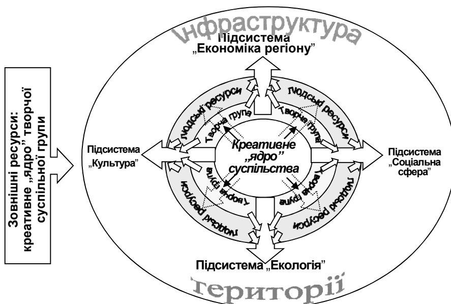
Рис. 1. Концептуальна схема формування каркасу території

Для усунення диспропорцій розвитку територій низка державних та регіональних проектів повинна спрямовуватися найперше на формування потенційних точок зростання. Переважно полюсами конкурентоспроможності є обласні центри, але розглядаючи стратегічні плани розвитку регіону, доцільно виділяти такі центри і на нижчих ієрархічних рівнях. Особливо актуальним є створення подібних полюсів на рівні малих міст та сільських поселень.