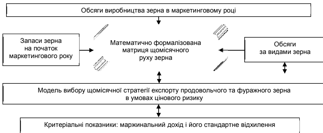
Рис. 3. Механізм оптимізації стратегії експорту зерна

Підсумовуючи зазначимо, що в Україні виробляються такі обсяги зерна, які більше ніж у 2 рази перевищують потребу у ньому (на продовольчі й фуражні цілі та насіння). Істотно збільшити витрати зерна у тваринництві наразі неможливо через проблеми, що мають місце у даній галузі. Тому на сучасному етапі експорт зерна є важливою передумовою ефективного розвитку аграрного сектора економіки. Механізм управління експортними відносинами з метою гарантування одержання максимального ефекту представлений на рис. 3.