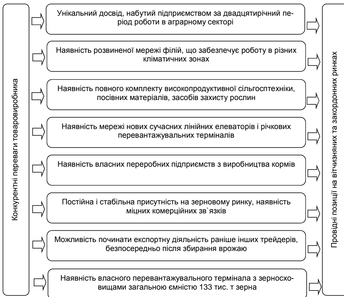
Рис. 2. Конкурентні переваги ТОВ СП “Нібулон” на зерновому ринку

У м. Миколаєві побудовано морський термінал компанії “Нібулон” для перевалки зернових та олійних культур. Цей потужний сучасний комплекс унікальний не тільки для України, але й для Європи. У 2011–2012 рр. компанія відвантажила на експорт 3,5 млн т сільгосппродукції. За підсумками першої половини 2012–2013 маркетингового року, компанія знову очолила рейтинг українських експортерів, забезпечивши 10,6 % всього українського експорту. За рахунок наявності конкурентних переваг ТОВ СП “Нібулон” впевнено утримує лідируючі позиції на зерновому ринку України (рис. 2).